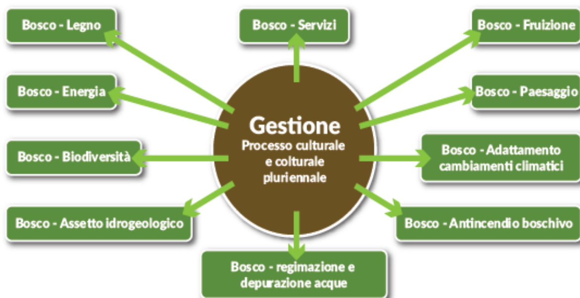
Figura 2 – Il ruolo e le funzioni della Gestione Forestale Sostenibile;

La nuova Strategia forestale dell'UE riprendendo i principi della Strategia europea del 1998 e i principi di sussidiarietà e corresponsabilità, stabilisce un quadro per il "settore forestale" di azioni mirate al sostegno di una Gestione Forestale Sostenibile. Presentata al Parlamento europeo e dal Consiglio, è stata elaborata dalla Commissione in stretta collaborazione con gli Stati membri e le parti interessate raggruppando vari aspetti di più ambiti politici complementari, tra cui sviluppo rurale, imprese, ambiente, bioenergia, cambiamenti climatici, ricerca e sviluppo.